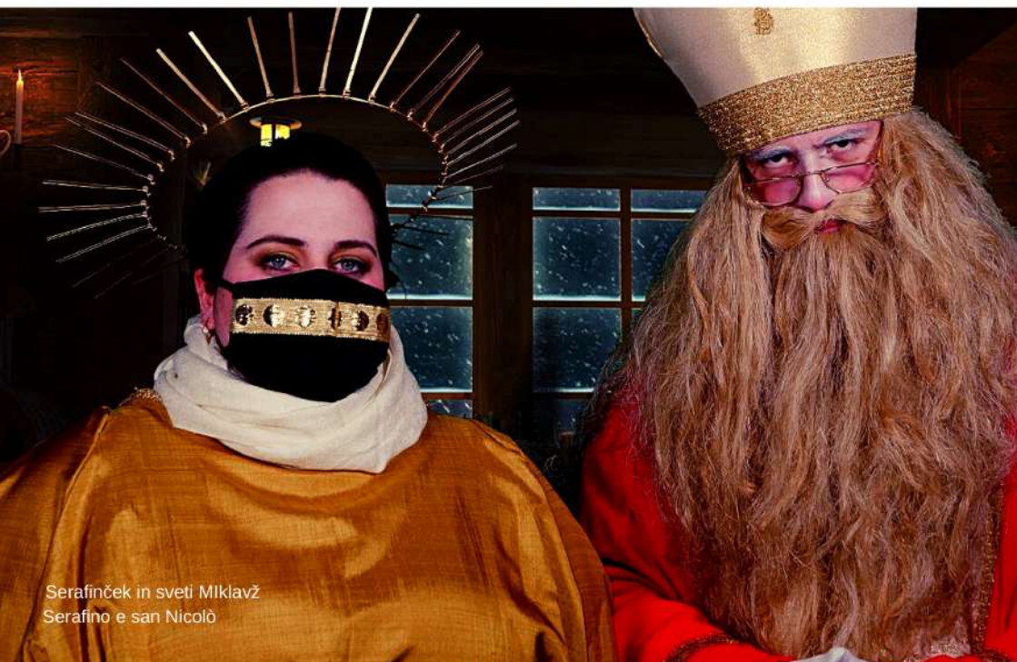
Serafinček in sveti Miklavž Serafino e san Nicolò